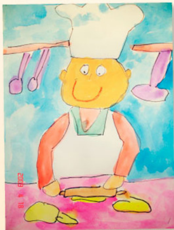
P6A 愛 黎海山