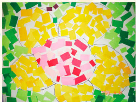
P6A 愛 王學斌